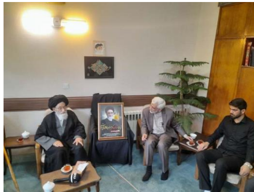
دیدار سعید جلیلی با پدر آل‌هاشم پیش از برگزاری انتخابات

منابع غیررسمی می‌گویند تعدادی از نوه‌های آل‌هاشم ستاد انتخاباتی پزشک‌های را تقویت می‌کردند و شمار دیگری از اطرافیان وی از جلیلی حمایت می‌کنند.