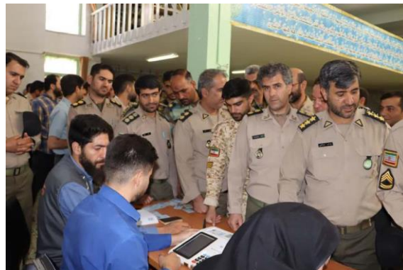
حضور اجباری افسران نیروی زمینی در پادگان‌ها در روز رای‌گیری