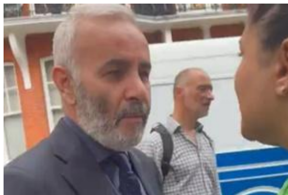
درگیری بین ژنرال خبرنگار بی‌بی‌سی پس از رای دادن و یک خانم مخالف جمهوری اسلامی

حامیان جمهوری اسلامی در خارج کشور هم پای صندوق رای در سفارتخانه‌های حکومت رفتند. فرخ نگهدار چریک سابق و از اتحاد جمهوری‌خواهان و الهه هیکس فعال «حقوق بشر»، مسعود بهنور روزنامه‌نگار و تحلیل‌گر سیاسی از جمله افرادی بودند که مثل همیشه پای صندوق رای نظام حاضر شدند. ایرانیان چپ و آزادی‌خواه ساکن کشورهای مختلف مانند گذشته با تجمع در مقابل سفارتخانه‌ها و هم‌چنین حوزه‌های رای‌گیری در کشورهای خود، تجمع کردند و علیه کلیت جمهوری اسلامی شعار دادند. اما باز هم در این تجمعات تعدادی سلطنت‌طلب با پرچم‌های خود و تصاویر رضا پهلوی به جای شعاردادن علیه جمهوری اسلامی، عمدتاً به افرادی ناسزا و گاهی با کلمات رکیک حمله کردند که در رای‌گیری جمهوری اسلامی شرکت کرده بودند. این گروه فشار، چه آگاهانه و چه ناآگاهانه عمدتاً در جهت اهداف جمهوری اسلامی در خارج کشور و بر علیه نیروهای چپ و کمونیست و مجاهدین خلق و سایر نیروهای مخالف جمهوری اسلامی، گام برمی‌دارند و اگر هم مانند شعبان بی‌مخ، زورشان برسد تجمعات اپوزیسیون را بر هم می‌زنند.