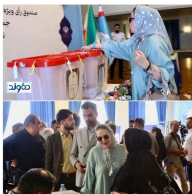
بهاره رهنما، هنرپیشه سینما در حال رای انداختن با عینک آفتابی

فرخ نگهدار هم اصرار عجیبی به تشویق مردم به رای دادن دارد. او در مطلبی نوشته بود: «... و من در روز هشتم تیرماه نیز در کنار اکثریت بزرگ مردم تحقیر شده و زخم خورده ایران خواهم ایستاد. و همه ما در دل آرزو خواهیم کرد، که از پی این انتخابات، روزنه ای گشوده شود... فرخ نگهدار - لندن - یکشنبه ۲۰ خرداد ۱۴۰۳