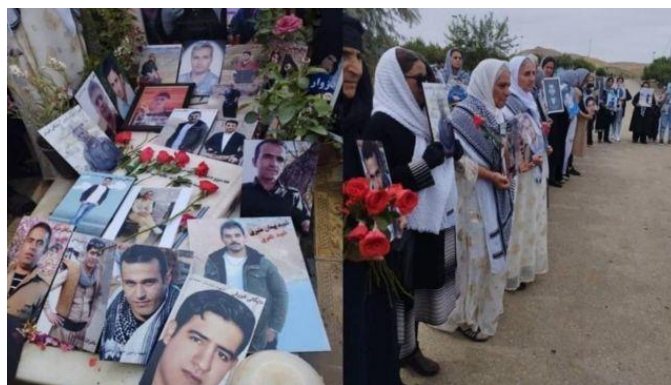
مادران دادخواه سنندج محل کشته‌شدن فرزندان خود را گلباران کردند