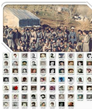
جان‌باختگان گردان شوان