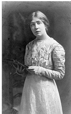
سیلویا پنکهرست فعال حقوق زنان بریتانیایی

در ۸ مارس ۱۹۱۴ در لندن نیز راهپیمایی از میدان «بو تا ترافالگار» در حمایت از حق رای زنان برگزار شد. «سیلویا پنکهرست» فعال حقوق زنان در بریتانیا در راه میدان ترافالگار برای سخن‌رانی، جلوی ایستگاه چارلز کراس دستگیر شد. سیلویا از جمله زنانی است که برای اعطای حق رای در بریتانیا تلاش کرد. در ۱۹۱۷ تظاهراتی تحت عنوان روز بین‌المللی زن در سنت پترزبورگ برپا شد که سرآغاز انقلاب فوریه بود. در این روز، زنان در سنت پترزبورگ برای «نان و صلح» در اعتصابات شرکت کردند و خواستار پایان دادن به جنگ جهانی اول، کمبود مواد غذایی روسیه و حکومت استبدادی مطلقه شدند.