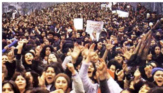
صحنه‌ای دیگر از تظاهرات زنان در اعتراض به حجاب اجباری در روز جهانی زن در سال ۱۳۵۷

پس از انحلال سازمان دولتی «کانون بانوان»، چندین جمعیت زنان، از قبیل «حزب زنان شفیه فیروز» و «جمعیت زنان»، دوباره با رهبری همان زنان آگاه، اعلام موجودیت کرده و بعضی از آن‌ها به انتشار نشریات خود دست زدند، از جمله، نشریه «زنان ایران» که کسب حق انتخاب کردن و انتخاب شدن در مشاغل سیاسی از جمله اهداف مهم آن بود. شاید بتوان گفت که سازمان‌های زنان در این دوره به‌طور کلی رادیکال‌تر از دوره‌های قبل بودند؛ هر چند که تقریباً هیچ‌کدام مستقل از احزاب سیاسی وقت نبودند و توسط زنان دارای امتیاز و مرفه گردانده می‌شدند که خود باعث نادیده‌انگاری تکثر و مسائل زنانی از طبقات دیگر جامعه و غیر مرکز نشین می‌شد. حقوق قانونی زن و مرد در خانواده که در چارچوب فقه شیعه در سال‌های ۱۳۰۷ و ۱۳۰۸ شمسی در قانون مدنی پهلوی اول مدون شده بود، تا اوایل دهه ۱۳۴۰ شمسی، تقریباً بدون تغییر مانده بود. بعدتر قانون حمایت از خانواده تصویب شد که مواد موجود در قانون مدنی و فقه اسلامی را کاملاً تغییر نداده بود، اما در این دوره با کمی تغییر به سود زنان پذیرفته شد که نتیجه تلاش‌های گروه‌های پراکنده زنان بود.