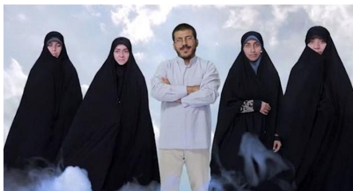
تبلیغ چند همسری: عکس از یک برنامه تلویزیونی جمهوری اسلامی ایران

در این بیانیه عنوان شده که این سرکوب‌ها گروهی از افراد را تحت‌تاثیر قرار می‌دهد که به دلیل پیروی از آیین بهایی و به دلیل زن بودن با تبعیض و سرکوب مضاعف مواجه هستند.