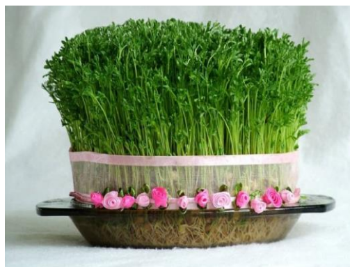
سبزه سفره هفت سین

این روز مصادف با سیزدهم فروردین است. در قدیم باور داشتند برای راندن نحسی باید از خانه خارج شد و در دامان طبیعت جشن گرفت. در تقویم ایران این روز را روز طبیعت نام گذاری کرده اند.