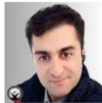
۴۳- رزگار بیگ زاده بابامیری

امیرحسین مقصودلو (تتلو) در آذرماه ۱۴۰۲ به خواست خود توسط پلیس ترکیه به ایران منتقل و در نهایت با هماهنگی مراجع قضایی بازداشت شد. در فروردین امسال سخنگوی قوه قضاییه از صدور حکم اعدام برای امیرحسین مقصودلو توسط شعبه شش دادگاه کیفری یک استان تهران خبر داده بود. اصغر جهانگیر اتهام آقای مقصودلو را “سب‌النبی” عنوان کرد. تتلو در خصوص پرونده ای دیگر از بابت اتهام تشویق به فساد و فحشا به ۱۰ سال زندان محکوم شد؛ این حکم توسط دادگاه تجدیدنظر تایید و پرونده وی به شعبه اجرای احکام ارسال شده است. در اردیبهشت امسال وکیل مدافع امیرحسین مقصودلو اعلام کرد که “درخواست ماده ۴۷۷ و خلاف شرع بودن رأی صادره ثبت و دستور رسیدگی توسط ریاست قوه قضائیه صادر شده است”. وکیل او اعلام نکرده است که این درخواست در رابطه با کدام پرونده آقای مقصودلو ثبت شده است.